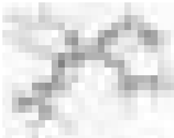
شکل ۲- ساختمان مولکولی آسفالتن

برش‌های سنگین نفت خام که دارای نقطه جوش بالای 500^{\circ}\text{C} می‌باشند، مقادیر زیادی آسفالتن دارند به طوری که در بعضی از موارد میزان آن به ۳۷ درصد می‌رسد. مولکول‌های آسفالتن دارای گروه‌های عامل فنلی و کربوکسیلیک و کربونیل بوده و نیز عناصری مانند S، N و O در ساختمان خود دارند و لذا قطبی می‌باشند و در حلال‌هایی که کمی