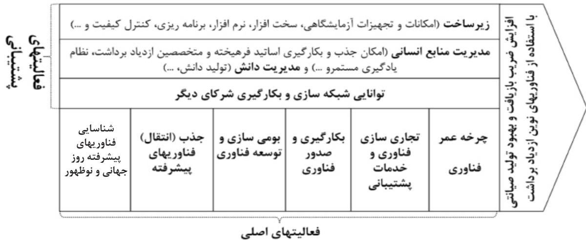
شکل ۱ مدل پیشنهادی زنجیره ارزش مراکز ازدیاد برداشت نفت در دانشگاه‌ها و مراکز تحقیقاتی کشور